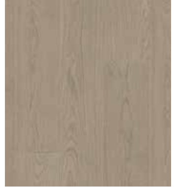
Eiche Cumin, Ultramattlack LTCLR4004-193