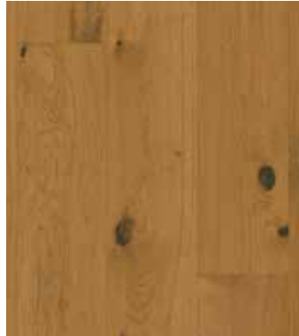
Eiche Pepper, Ultramattlack LTCLR4013-193