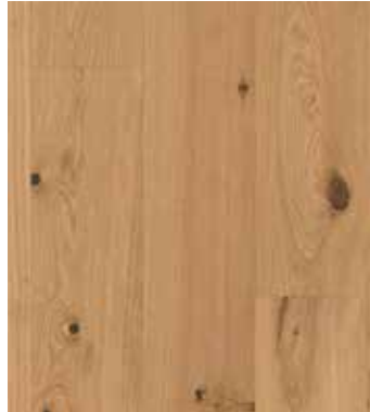
Eiche Cardamom, Ultramattlack LTCLR4011-193