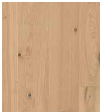
Eiche Fennel, Naturöl LTCLR4015-193