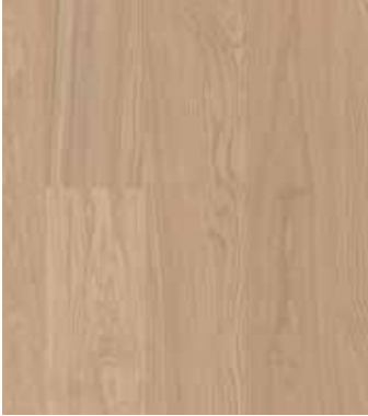
Eiche Ginger, Ultramattlack LTCLR4002-193