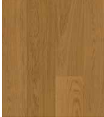
Eiche Cloves, Ultramattlack LTCLR4003-193