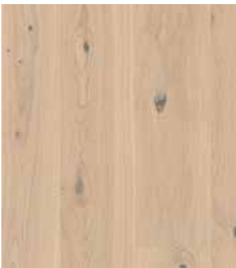
Eiche Tahini, Naturöl LTCLR4016-193