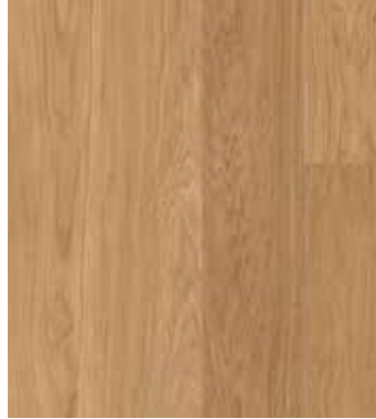
Eiche Nutmeg, Ultramattlack LTCLR4001-193