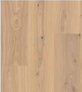
Eiche Tumeric, Ultramattlack LTCLR4012-193