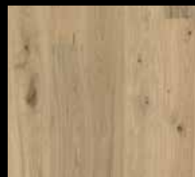
EICHE GENTIAN 131249220