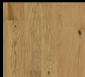
EICHE ASTER 131248220