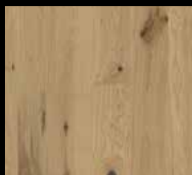
EICHE YARROW 131245220