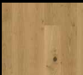
EICHE ASTER 131246220