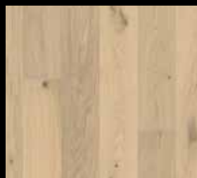
EICHE EDELWEISS 131247220